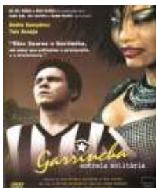
Figura 2: cartaz do filme Garrincha