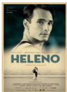
Figura 1: cartaz do filme Heleno

Dirigido por José Henrique Fonseca, o filme foi lançado em 2012 e apresenta uma cinebiografia do jogador de futebol Heleno de Freitas, ídolo do Botafogo na década de 1940. Em 116 minutos são mostrados os momentos de glória e de decadência de um dos maiores jogadores brasileiros de todos os